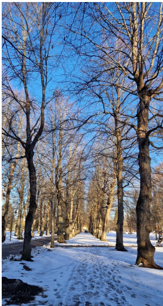
Boulognerskogen i Gävle den 16/3 2023